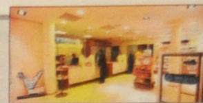
De apotheek van het sociaal centrum.